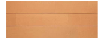
ナチュラルパーチ(パーチ突板)