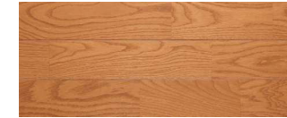
アーティパーチ(オーク突板)