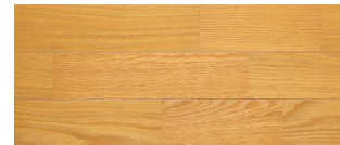
ナチュラル(オーク突板)

※画像はイメージです。 ※経時変化 / 天然木の樹種や条件により一定ではありませんが、紫外線の吸収により時間経過とともに変色します。 ※天然木を使用しておりますので製品一枚、ピース一枚ごとに色柄が異なります。