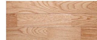
クリア(オーク突板)