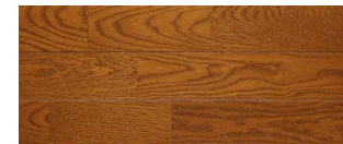
ブラウン(オーク突板)