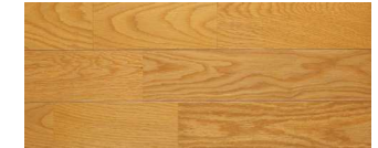
ライトブラウン(オーク突板)