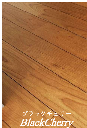
ブラックチェリー BlackCherry

※画像はイメージです。 ※経時変化 / 天然木の樹種や条件により一定ではありませんが、紫外線の吸収により時間経過とともに変色します。 ※天然木を使用しておりますので製品一枚、ピース一枚ごとに色柄が異なります。