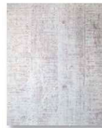
クラシックホワイト